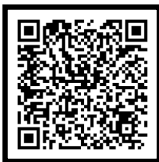
TABLEAU DES NOMBRES