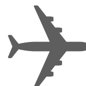
l'avion aller / venir en avion