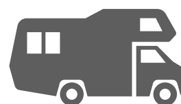
le camping-car aller / venir en camping-car