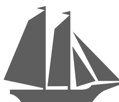
le bateau aller / venir en bateau