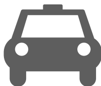
le taxi aller / venir en taxi