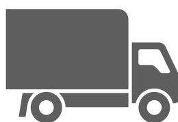
le camion aller / venir en camion