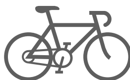
le vélo aller / venir à vélo